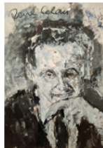
PAUL CELAN © Maler Armin Müller-Stahl