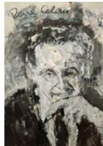
PAUL CELAN © Maler Armin Müller-Stahl