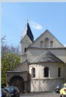
Kloster/Krankenhaus- Kapelle Neuwerk