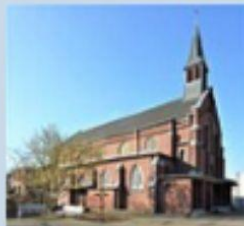
St. Bonifatius Hardterbroich