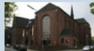
St. Barbara - Kloster Bunter Garten