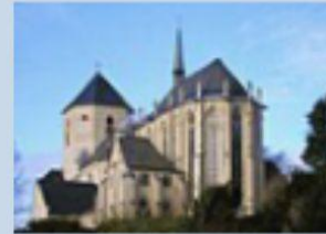
Münster-Basilika St. Vitus Abteiberg