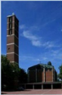
St. Maria Himmelfahrt Neuwerk