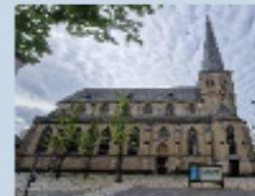
Citykirche Alter Markt