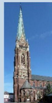
St. Maria Rosenkranz Eicken