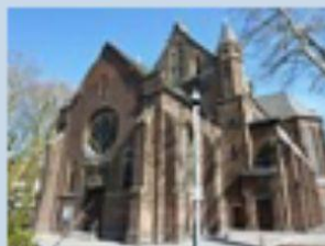
St. Mariä Empfängnis Lürrip