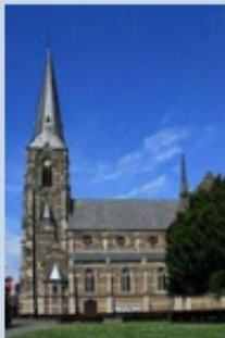
Herz Jesu Bettrath