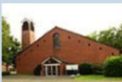
St. Pius X. Uedding