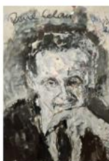
PAUL CELAN © Maler Armin Müller-Stahl