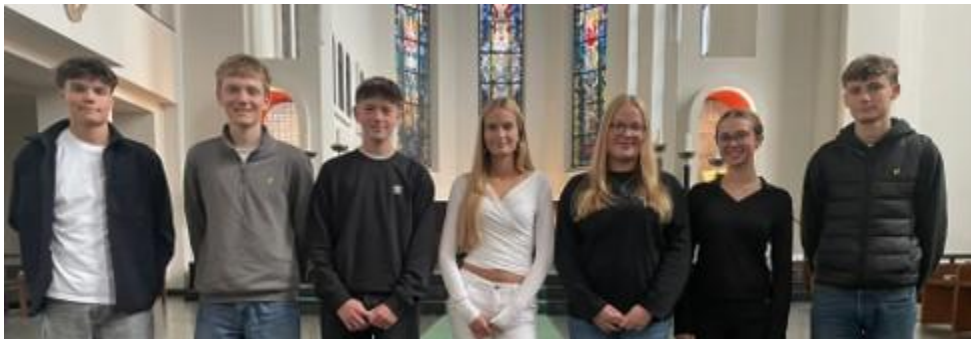
Die Firmlinge von St. Barbara